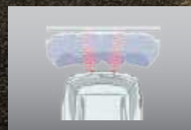
REAR PARKING SENSOR

Menghadirkan perlindungan lebih dan memperkecil resiko cedera. (All Type)