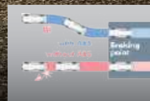
ABS & EBD

Memudahkan parkir dengan sensor di bagian belakang kendaraan. (All Type)